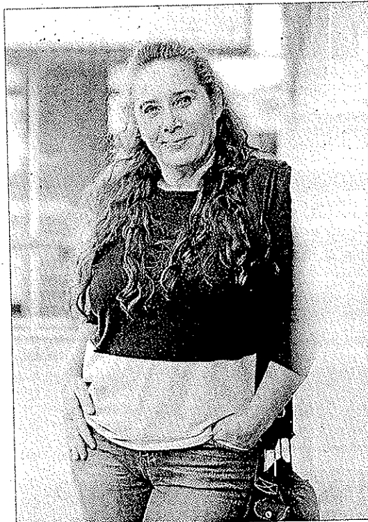
La vicepresidenta del Consell d'Eivissa, ayer en Maó.

— Lo que hemos visto este verano en Eivissa es que el colectivo de trabajadores de temporada o dormían en vehículos o en acampadas a las afueras de los núcleos urbanos. La práctica más habitual es que se abonen a un gimnasio para poder tener la ducha diaria. Tenemos una nueva clase social, que son los trabajadores sin techo y esto está perjudicando al propio negocio, que se queda sin profesio-